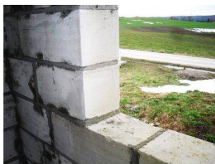
zdjęcie nr 1

Gdy otwory okienne są w zadowalający sposób wypoziomowane a ich powierzchnie gładkie nie musimy dodatkowo przygotowywać takiego otworu. W przypadku murów z pustaków otworowych powierzchnia pustaków musi być pokryta wylewką betonową. Na tym etapie zaleca się stosowanie materiałów termoizolacyjnych przeznaczonych do murowania ścian jednowarstwowych lub o podobnych właściwościach mrozo i wodoodpornych.