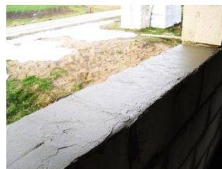
zdjęcie nr 3