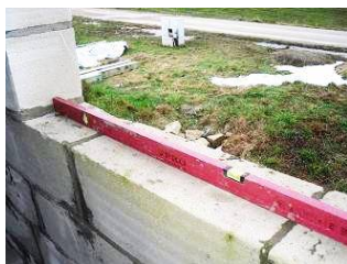
zdjęcie nr 2